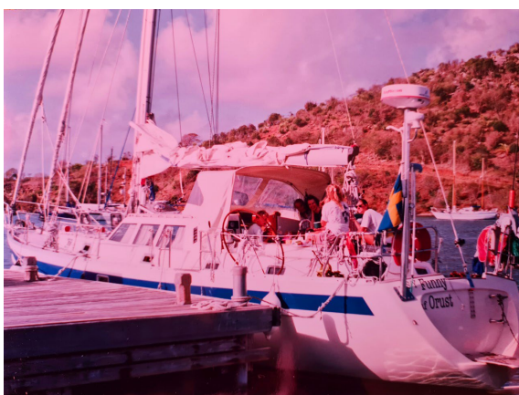
s/y Funny, Forcus 52

Vi är nu framme i mars / april och högsäsongen för hemsegling till Sverige pågick som mest. Hade först tänkt att försöka lifta hem med en annan båt men siktet blev sedan inställt på flyg hem. Men på Bequia går det fort och på första kvällen blev något blöt och jag träffade besättningen på s/y Funny, en Forcus 52 (16,5m) byggd av 4 st. grabbar från Orust, varav 1 var med som skeppare & resterande 7 ungdomar ombord hade köpt sig en 2 månaders atlantsegling via sjösportskolan Göteborg.