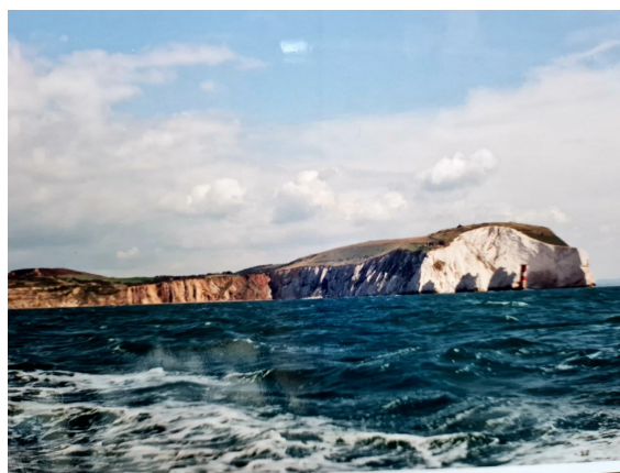
Ögruppen The Needles

många timmar motström med några timmar slackvatten emellan. Med varierande strömstyrka, ibland kanske 4-5 knop. Mycket fartygstrafik att hålla koll på utanför Rotterdam inte minst innan vi la till i Zeebrugge som första stopp efter kanalen. Underbart med fast mark under fötterna och Belgien är ett fint land, blev en kort segling till Oostende med innan vi tog skuttet över till Dover, England.