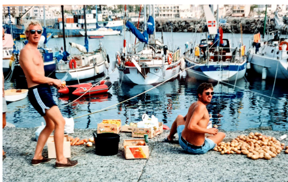
Bunkring av mat i Arguineguin

Att ta ombord mat är inte bara, då risken för bl.a. kackerlackor är stor i värmen. Dom vill gärna gömma ägg i förpackningarna.