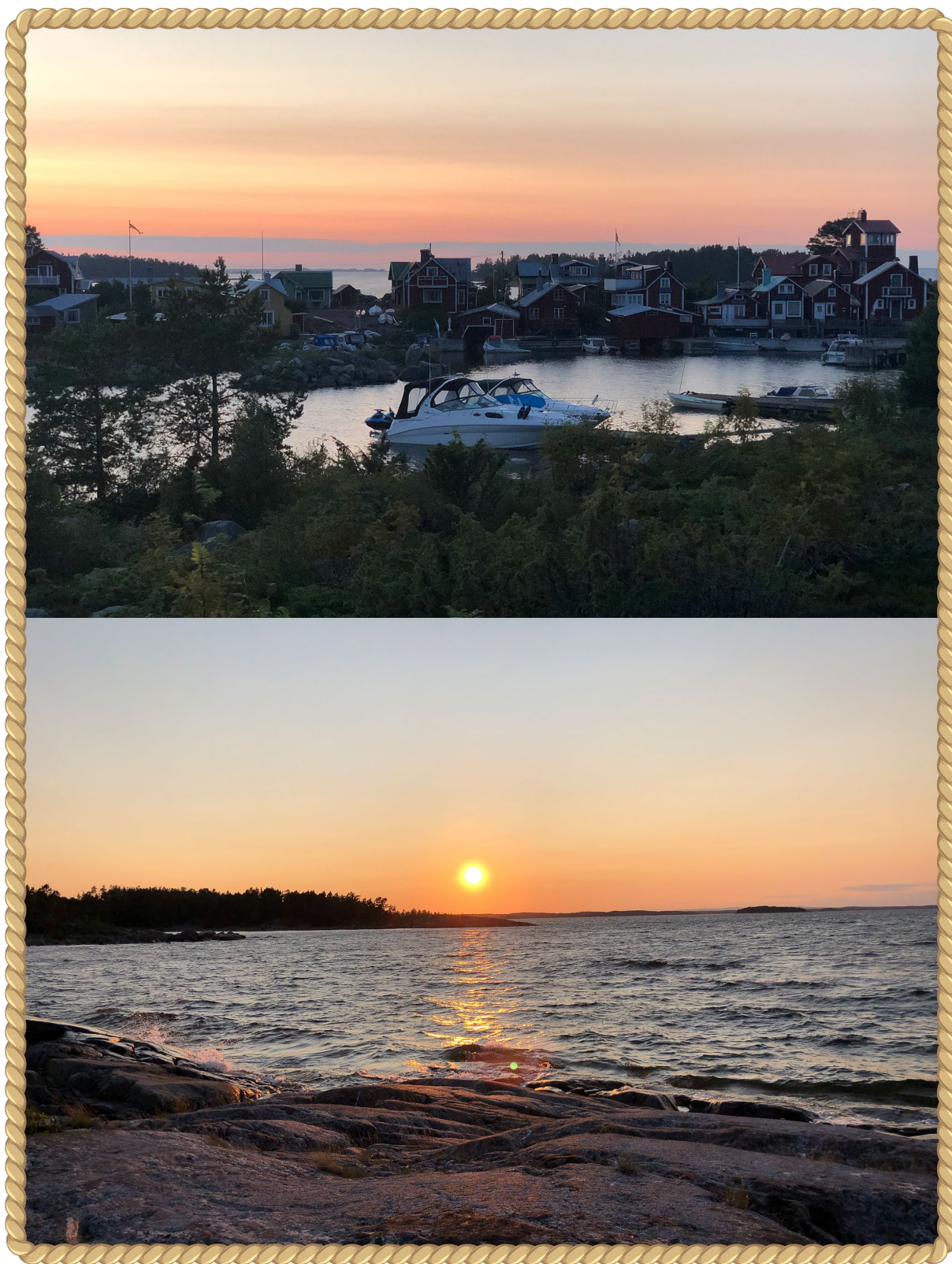
Övre bilden Rönnskär. Under bilden Ravelgrund, Hudiksvall