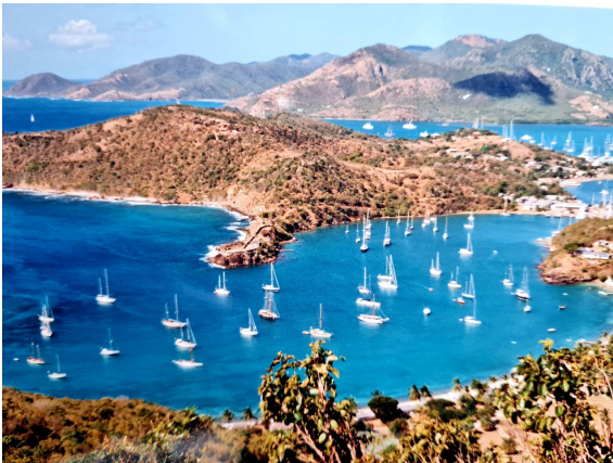
Leeward Islands, English harbour

Vi siktade in oss på Antigua i norra delen av Leeward Islands, English Harbour. Här kan man göra lite olika såklart, en del seglar ner till Kap Verdeöarna söder om Kanarieöarna och därifrån över Atlanten, kanske till Brasilien, Trinidad / Tobago eller kanske Barbados. Valmöjligheterna är stora.