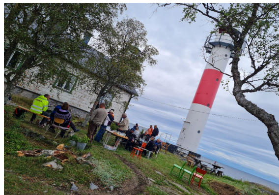
Fyrens dag, Agön